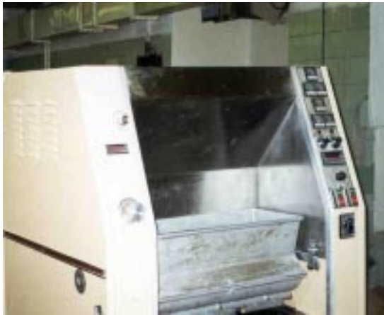
Оборудование для выпечки печенья.

простаивало и было как-то использовано, была освоена выпечка диетического печенья на сое. «Деметра-1» реализует это печенье в своем магазине «Майский чай» и через сеть диетических магазинов Москвы. Выплаты лизинговых платежей по этому оборудованию, пожалуй, наиболее тяжелые для предприятия. Поэтому Пеленицына обратилась с просьбой отсрочки лизинговых платежей по этому оборудованию на какое-то время. Московская лизинговая компания решила сократить объем ежемесячных лизинговых платежей с 2 тыс. долл. США до 16 тыс. рублей и продлить срок лизингового