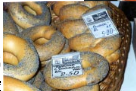
Мини пекарня и продукция ТОО «Деметра-1»

Вид оборудования приобретенного в лизинг: Мини-пекарня